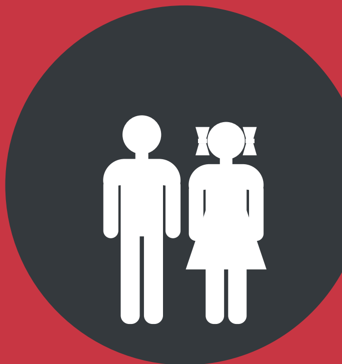
Школьники 8-16 лет

Ответственно исследовано и доказано многими десятилетиями, что целевая аудитория вафель от бренда «Вафельница» фактически безгранична. Но есть особые любители данного продукта: