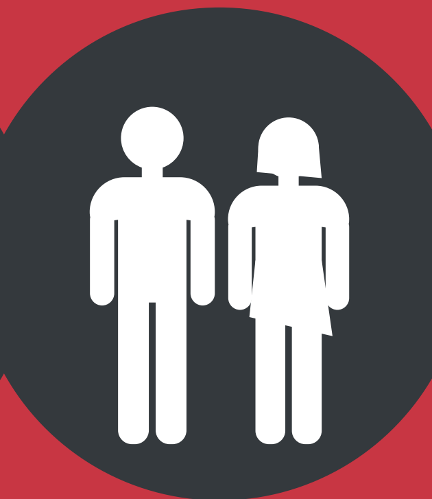
Студенты 16-26 лет