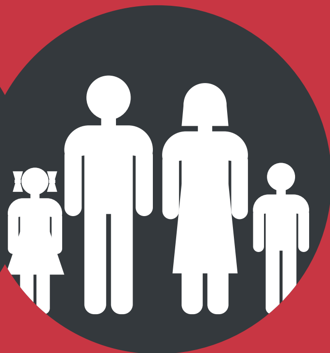
Семейные пары 22-45