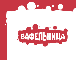
и их дети 3-15 лет